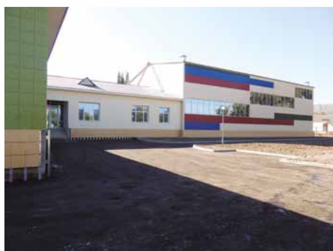
Спортзал ср. школы, с. Каратальское, Алм. обл