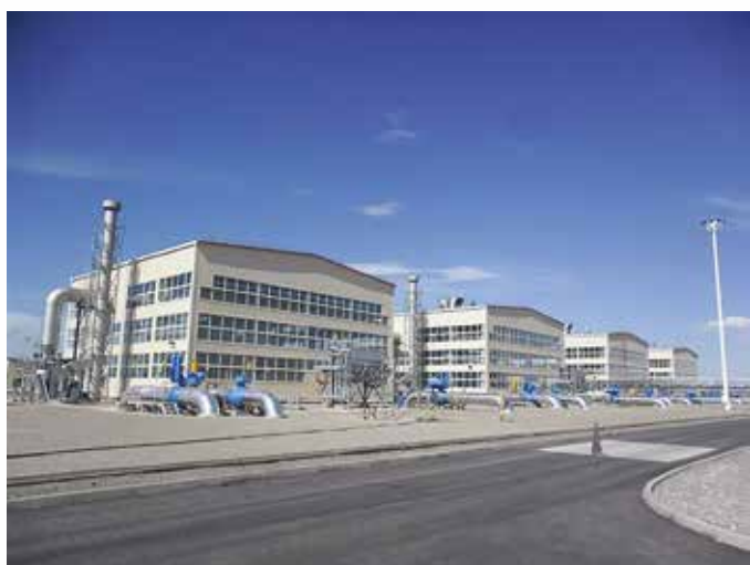
Компрессорные цеха 3