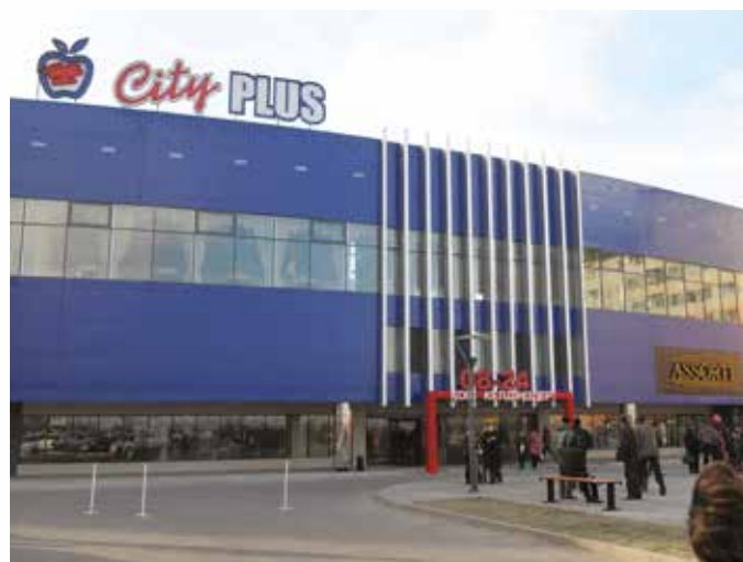
Торговый центр Сити Плюс Талдыкорган