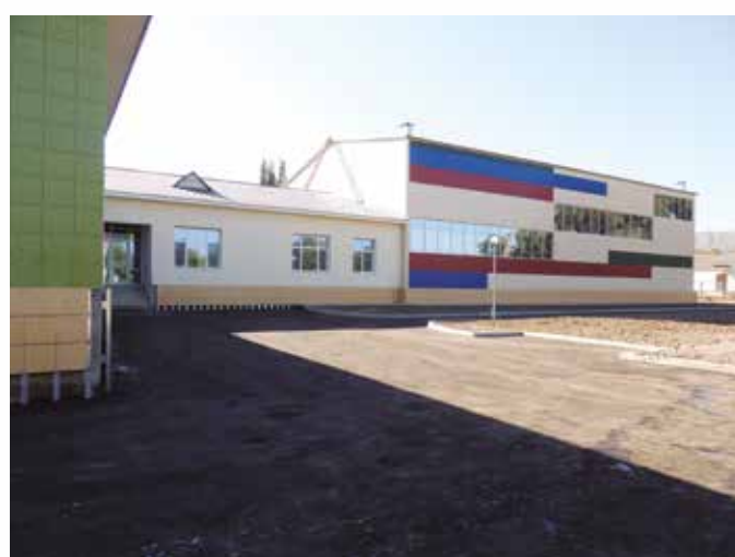
Спортзал ср. школы, с. Каратальское, Алм. обл