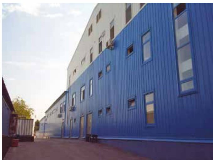
Завод АРКТИК Алматы