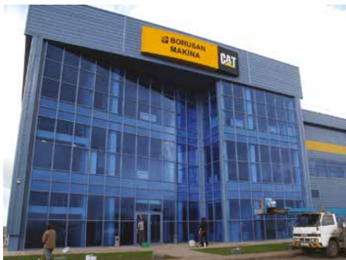
Сервисный центр тяжелой техники BORUSAN MAKINA