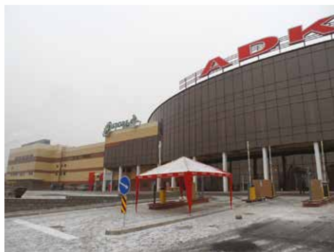
АДК Астория г. Алматы