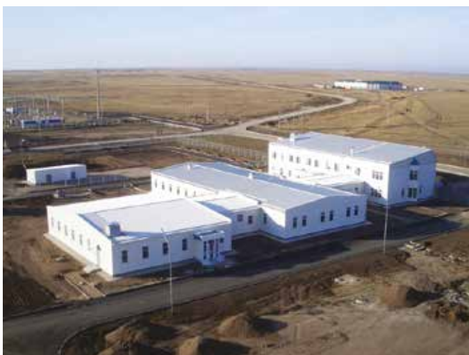
Промышленный комплекс урановых месторождений СЕМИЗБАИ