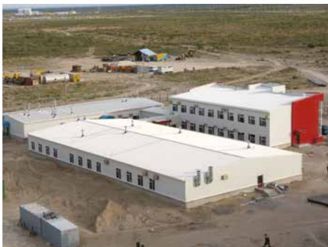
Промышленный комплекс урановых месторождений Харасан-2